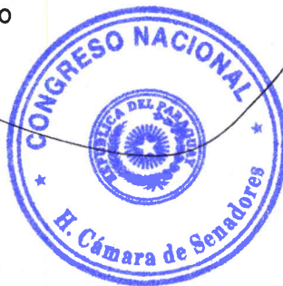
Silvio Ovelar B. Presidente H. Cámara de Senadores

A Su Excelencia Raúl Luis Latorre Martínez , Presidente Honorable Cámara de Diputados Poder Legislativo